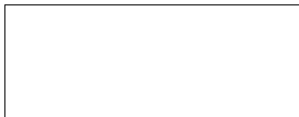
Схема границы балансовой принадлежности тепловых сетей

Прочие сведения по установлению границ раздела балансовой принадлежности тепловых сетей